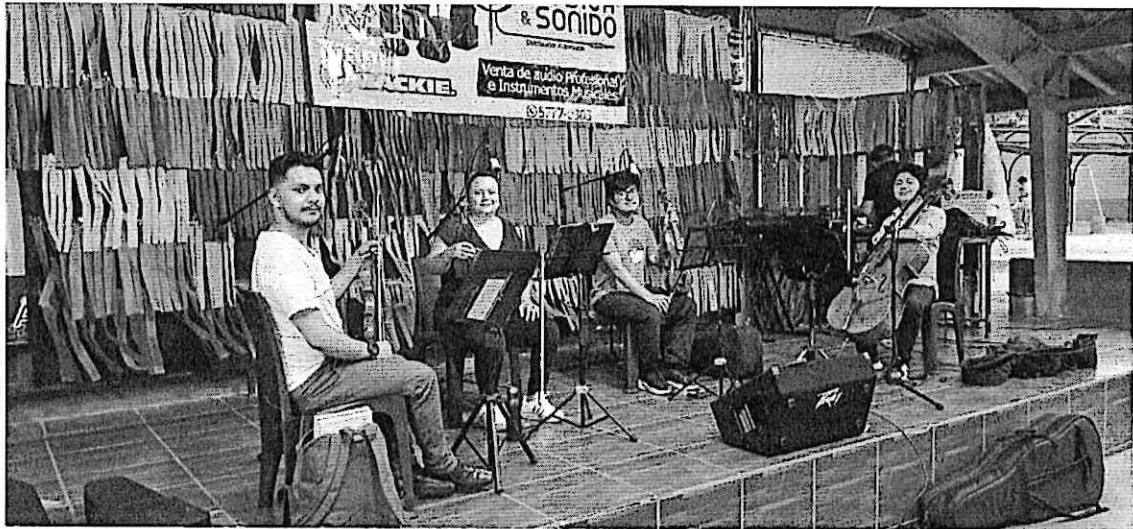
Cuarteto Primavera probando sonido previo al concierto