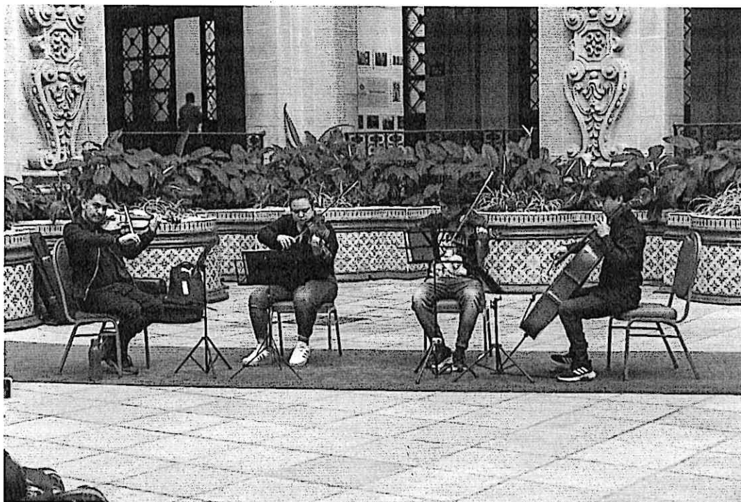
Ensayo público del cuarteto en el Palacio de la Cultura

El público disfrutó mucho de la cercanía al Cuarteto Primavera, consultando acerca de las cuerdas que utiliza cada instrumento, los nombres de los instrumentos, el tiempo que lleva el montaje de una pieza y el escuchar las distintas melodías a ensayar.