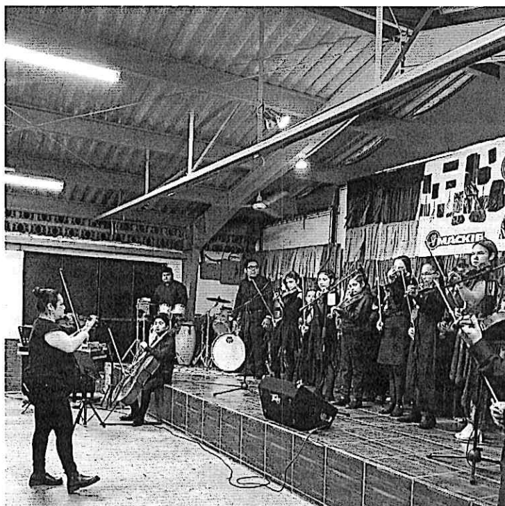
Cuarteto Primavera y estudiantes de la orquesta juvenil de Zacapa durante el concierto

De 15:00 a 18:00h se llevaron a cabo talleres dirigidos a los estudiantes de la Orquesta Juvenil de Zacapa y de Chiquimula, quienes participaron con gran dedicación y entusiasmo. Las sesiones culminaron con un ensamble conjunto junto al Cuarteto Primavera, destacando el compromiso de los jóvenes músicos por mejorar su técnica y desarrollar sus habilidades interpretativas. Más tarde, a las 19:00h, se ofreció un concierto en el Colegio Luterano, donde el público disfrutó de un variado repertorio que abarcó música latinoamericana, nacional y centroeuropea. Los asistentes mostraron especial aprecio por las obras nacionales y latinoamericanas, además de un profundo interés por las composiciones centroeuropeas y la colaboración entre los estudiantes y el cuarteto.