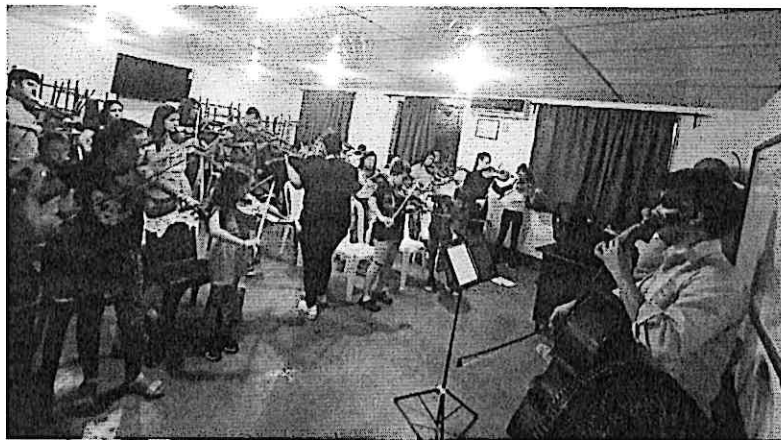
Taller a los estudiantes de la Orquesta Juvenil de Zacapa y de Chiquimula