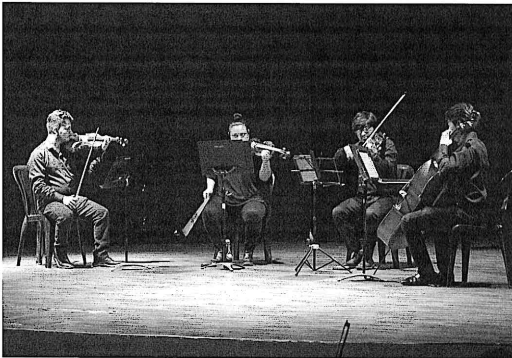
Cuarteto Primavera durante la presentación

El concierto se realizó a las 4:30 p.m. en el Centro Cultural de Escuintla, presentando un repertorio variado que abarcó música latinoamericana, nacional y centroeuropea. El público disfrutó enormemente de las interpretaciones, expresando un especial aprecio por las piezas nacionales.