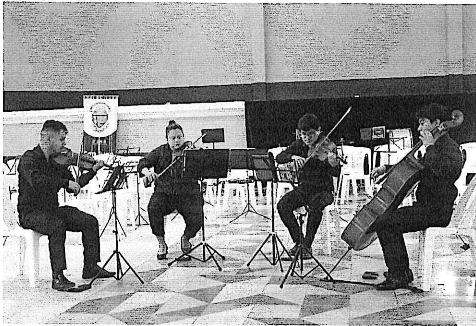
Cuarteto Primavera durante la presentación en el Salón "El Jocoteco"