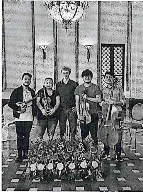
Ensayo público en el Palacio de la Cultura con el solista francés Frédéric Pelassy